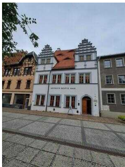
Heinrich-Schütz- Haus Weißenfels