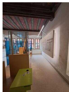
Heinrich-Schütz- Haus Weißenfels