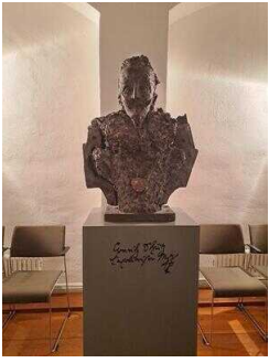
Heinrich-Schütz- Haus Weißenfels