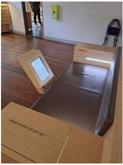
Heinrich-Schütz- Haus Weißenfels