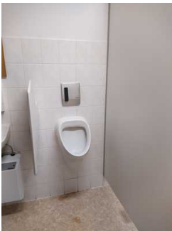
Urinal Öffentliches WC Herren