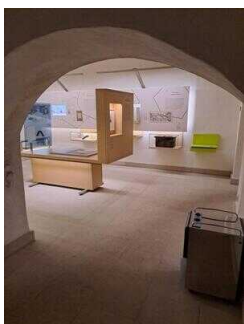
Heinrich-Schütz- Haus Weißenfels