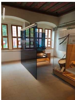
Rundweg Ausstellung Erdgeschoss