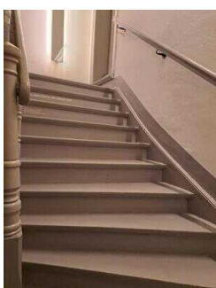
Heinrich-Schütz- Haus Weißenfels