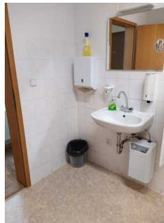
Waschbecken Öffentliches WC Herren