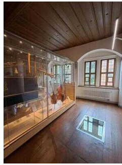
Heinrich-Schütz- Haus Weißenfels