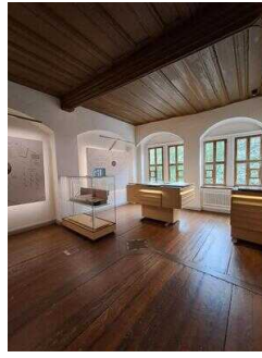
Heinrich-Schütz- Haus Weißenfels