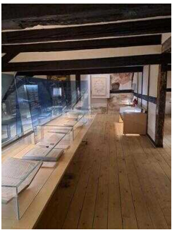
Heinrich-Schütz- Haus Weißenfels