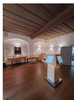
Heinrich-Schütz- Haus Weißenfels