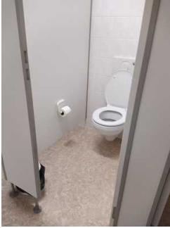
Öffentliches WC Herren