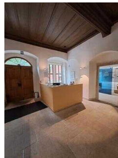
Heinrich-Schütz- Haus Weißenfels