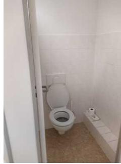
Öffentliches WC Herren